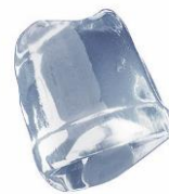
36 gr FULL ICE CUBE